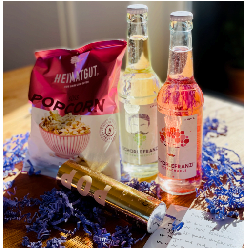
Optionales Überraschungspaket für die Teilnehmer:innen